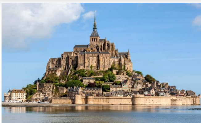
Baie du Mont St Michel